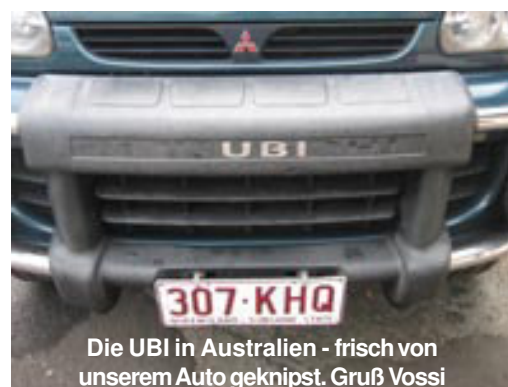
Die UBI in Australien - frisch von unserem Auto geknipst. Gruß Vossi